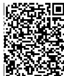
Salon des fabricants de matériaux en terre crue Stand de 3m 2

Suite à votre contribution, l'AsTerre reviendra vers vous pour collecter les informations complémentaires. Pour toute question, merci de contacter l'AsTerre via l'adresse secretariat@asterre.org