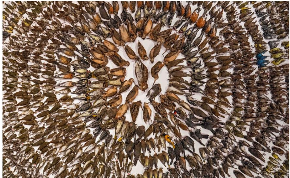
Victimes de collisions collectées pendant les migrations de printemps et d'automne 2017 dans quelques quartiers de Toronto, Mississauga et Markham, Canada, par des volontaires et des bénévoles de l'organisation FLAP (Fatal Light Awareness Program).